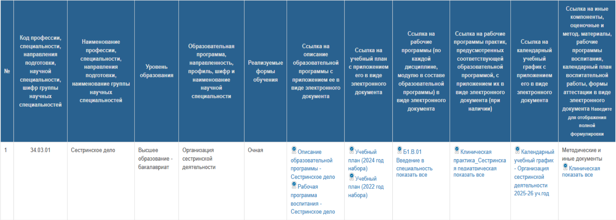
Информация по образовательным программам

Информация о реализуемых образовательных программах, включая адаптированные образовательные программы (при наличии), представляемую в виде образовательной программы в форме электронного документа или в виде активных ссылок, непосредственный переход по которым позволяет получить доступ к страницам Сайта, содержащим отдельные компоненты образовательной программы, в том числе: • об учебном плане с приложением его в виде электронного документа; • о календарном учебном графике с приложением его в виде электронного документа; • о рабочих программах учебных предметов, курсов, дисциплин (модулей) в виде электронного документа; • об иных компонентах, оценочных и методических материалах, а также в предусмотренных Федеральным законом от 29.12.2012 № 273-ФЗ «Об образовании в Российской Федерации» случаях в виде рабочей программы воспитания, календарного плана воспитательной работы, форм аттестации в виде электронного документа.