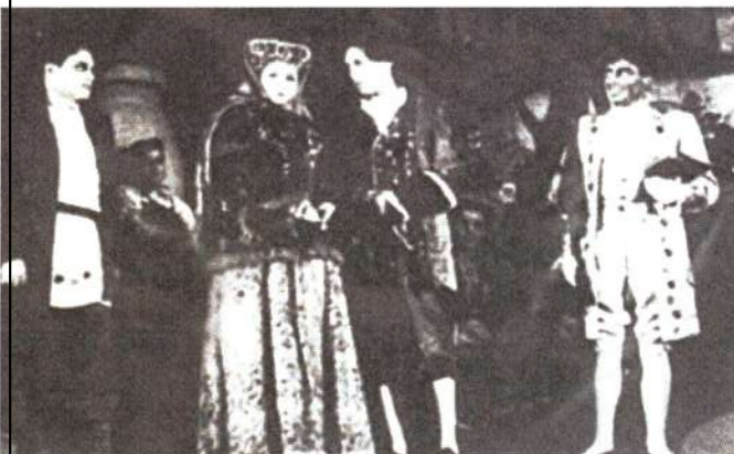
Спектакль «Табачный капитан», 1945 г.