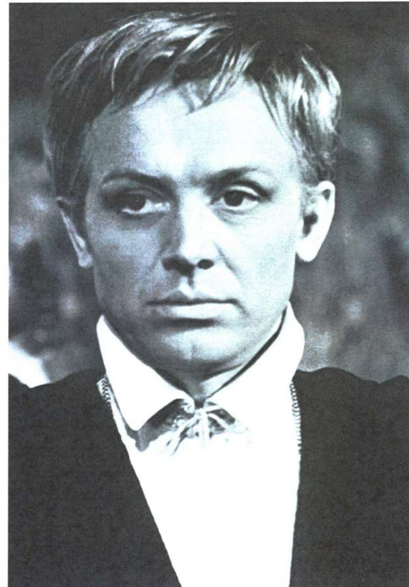
В роли Гамлета в фильме «Гамлет» (1964)