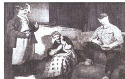
Спектакль «Свадьба в Малиновке», 1945 г.