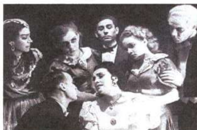
Артисты фронтовой бригады Хабаровского театра музыкальной комедии. Китай, Харбин, 1945 г.