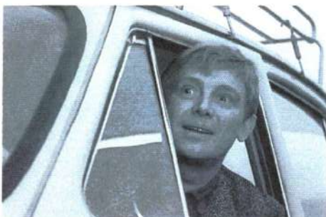
В роли Деточкина в фильме «Берегись автомобиля» (1966)