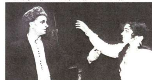
Спектакль «Свадьба в Малиновке», 1945 г.