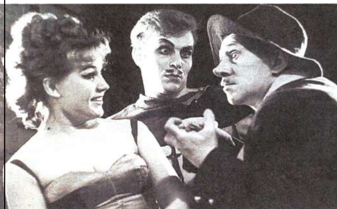
Оперетта «Роз Мари», 1945 г.