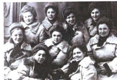
Диверсионно-разведывательная группа девушек в/ч № 9903