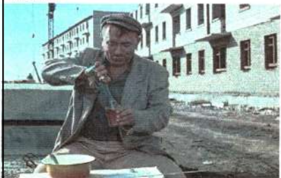
В роли Феди «Операция Ы и другие приключения Шурика» (1965)