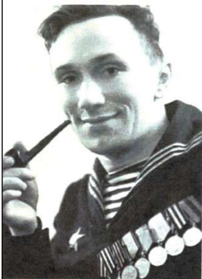
Фотогробы для одной из ролей (со своими боевыми наградами)