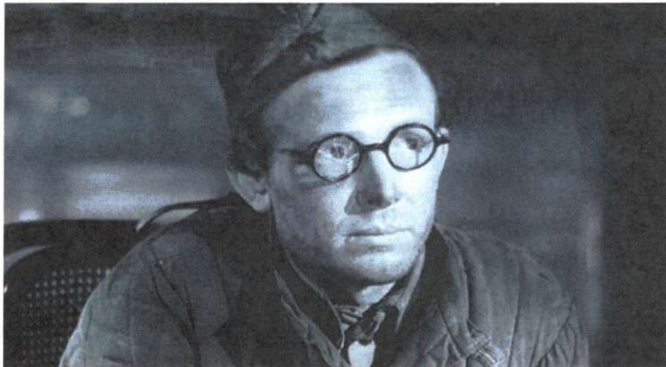
В роли Фарбера в фильме «Солдаты» (1956)