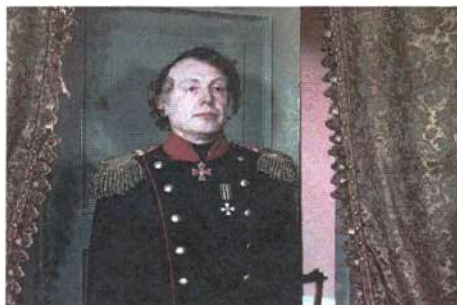
В роли Иркутского губернатора Ивана Богдановича Цейдлера в фильме «Звезда пленительного счастья» (1975)