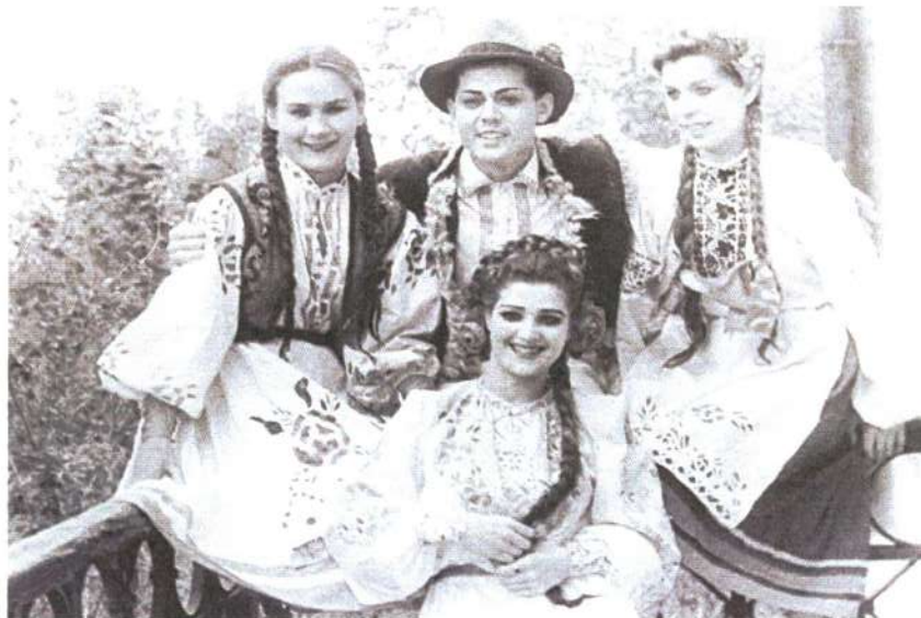
Артисты из оперетты «Сорочинская ярмарка», 1945 г.