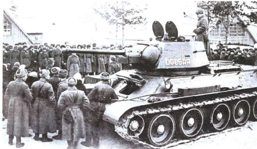
Передача танка «Боевая подруга» войсковой части