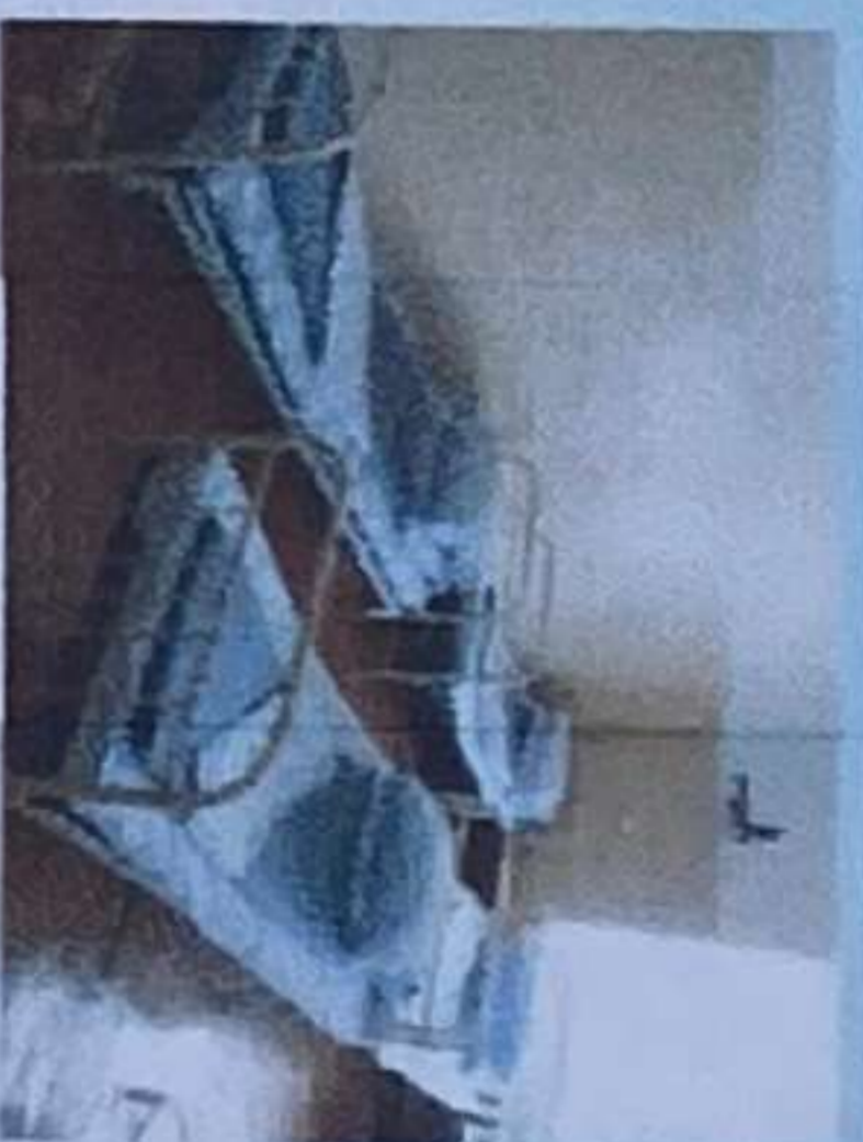
Условия размещения больных