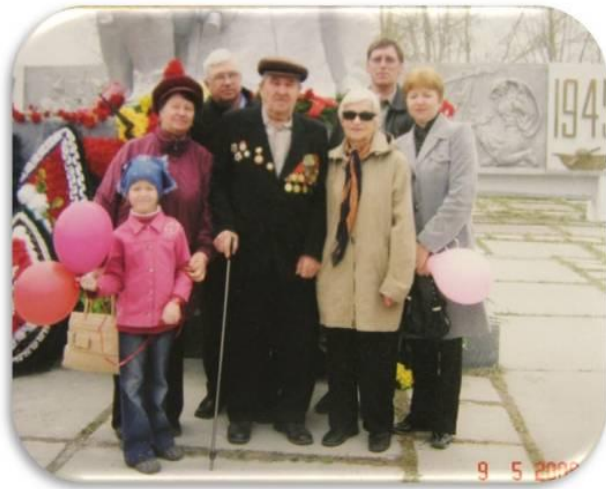
Всей семьей на Параде