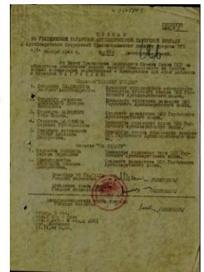
Приказ о награждении орденом Красной Звезды