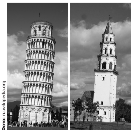
2021 год объявлен годом Италии в России

— Отраднo, что проект продолжает жить и находить новых сторонников.