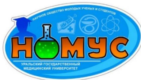
Рис. 1. Логотип научного общества молодых ученых и студентов УГМУ

Оформление рисунка представлено на рисунке 1.