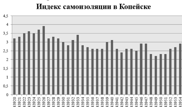
Рис. 1. Индекс самоизоляции в Копейске с 30 марта по 3 мая

Рассматривая средний индекс самоизоляции по дням (рис. 1) для города Копейска в период с 30 марта (дата начала оплачиваемых каникул [14]) по 3 мая, наблюдаются следующие общие закономерности: к выходным и праздничным дням среднее значение индекса повышается, наблюдается постепенное общее снижение индекса с течением времени.