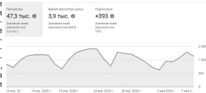
Рис. 3. Характеристика посещений студентами электронных образовательных ресурсов кафедры гистологии за период дистанционного обучения в условиях развития коронавирусной инфекции Covid-19 с 10 апреля 2020 г. по 07 мая 2020 г. Скриншот с раздела статистики аудитории канала YouTube