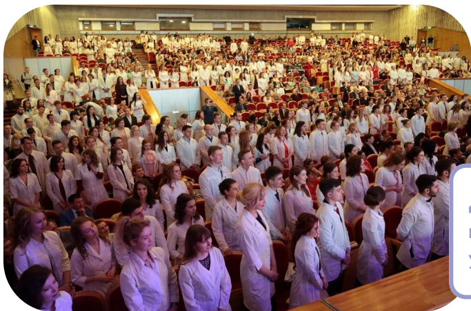
День первокурсника в УГМУ

«Нужно легче относиться к оценкам, принимать их как свои ошибки и стараться исправить. Не стройте ожидания и не разочаруетесь»