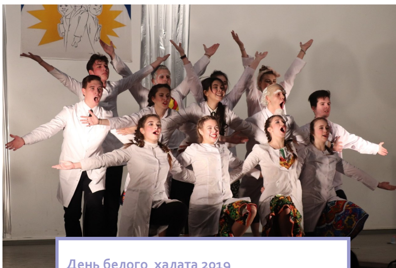
День белого халата 2019