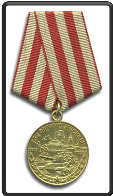
Медаль "За оборону Москвы"