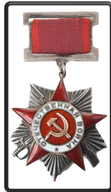
Орден Отечественной войны I степени