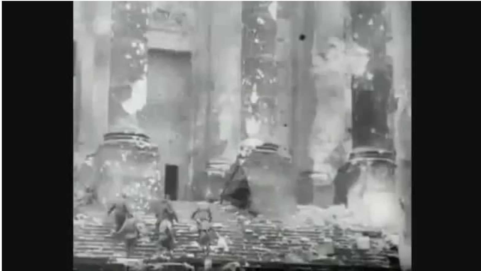
Водружение знамени победы над Рейхстагом ,1945, Берлин, Германия