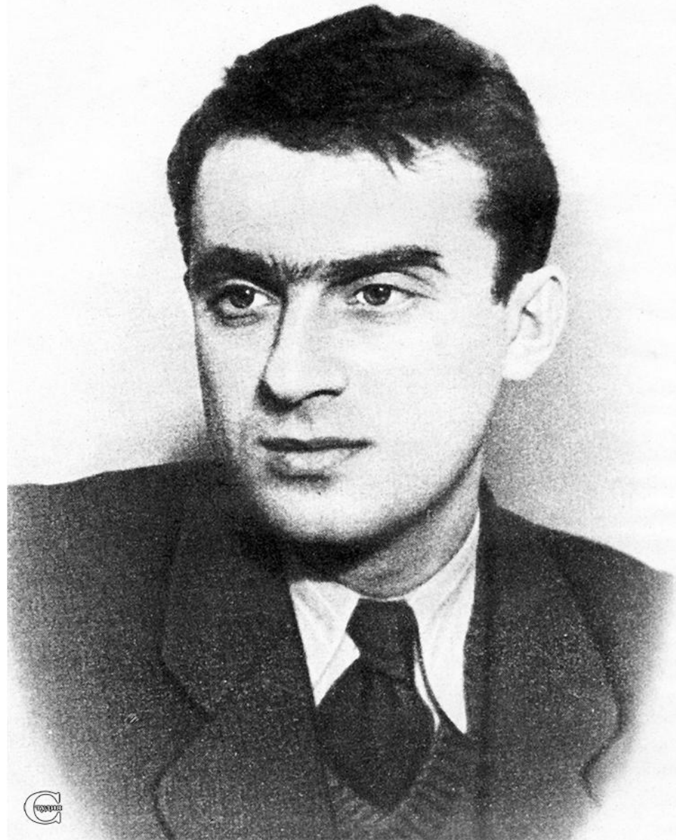
Семён Петрович Гудзенко