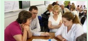
Итоговая государственная аттестация выпускников факультета