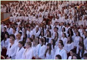
Первокурсники произносят клятву студентов-медиков