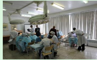
Студенческая олимпиада по хирургии