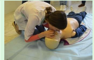
Отработка навыков сердечно-легочной реанимации