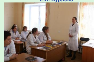
Практическое занятие на кафедре пропедевтики внутренних болезней (клиническая база СОКБ №1

Создано и функционирует более 40 подразделений специализированной помощи. Ежегодно оказывается консультативная помощь почти 50000 больным.