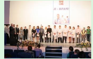
Конкурс для выпускников вуза «Я – врач»

Студенты факультета занимаются в пяти учебных корпусах, в которых расположены современно оборудованные аудитории, учебные лаборатории, секционные и экспериментальные операционные, а также музеи – анатомический, патологоанатомический, музей судебной медицины и оперативной хирургии.