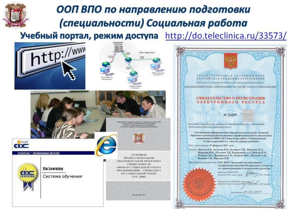
Рис 2 Электронный учебно-методический комплекс (э-УМК) учебной дисциплины

Выпускающей кафедрой самостоятельно разработаны оригинальные электронные учебные курсы, подтвержденные авторскими свидетельствами: Электронный информационно - образовательный ресурс «ООП ВПО специальности 040101.65 Социальная работа. Специализация социальная работа в системе здравоохранения» / ГАН РАО ИНИиМ ОФЭРНИО Свидетельство о регистрации электронного ресурса № 16689 от 09.02.2011. Электронный информационно - образовательный ресурс по курсу «Социальная работа в сфере охраны здоровья населения» / ГАН РАО ИНИиМ ОФЭРНИО Свидетельство о регистрации электронного ресурса №16417 от 25.11.2010.