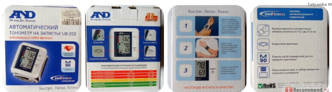
Наименование: Автоматический тонометр на запястье