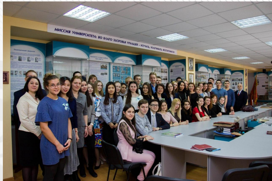
Музей истории УГМУ