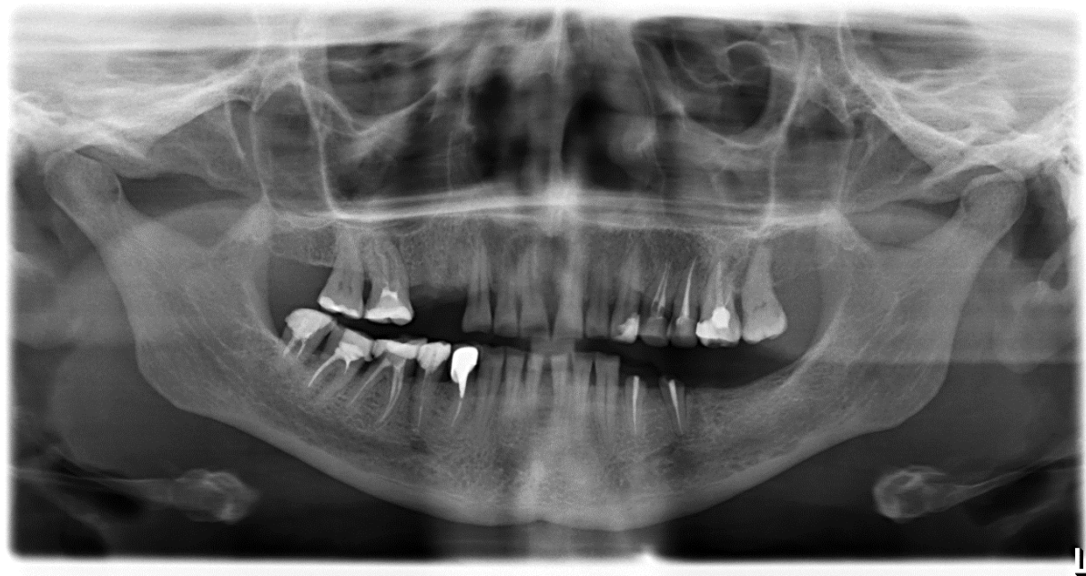
Рис. 1. Рентгенограмма больной С. на момент обращения.

Объективно: Лицо симметрично, высота нижнего отдела лица не изменена. Рот открывается в полном объеме. Хруста и болезненности в области ВНЧС при открывании рта не отмечается. Лимфатические узлы при пальпации не определяются. Слизистая оболочка полости рта бледно – розовая без видимых патологических явлений. Все имеющиеся зубы устойчивы. Прикус фиксированный. Имеются рентгенограммы (рис.1, 2).